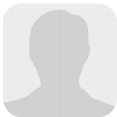
Thomas Gräble https://steuerberater-graessle.de/